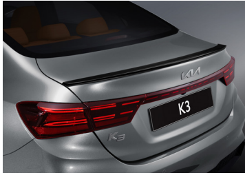
블랙하이그로시 리어 스포일러