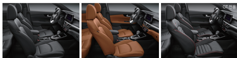
블랙 인테리어(가죽/인조가죽) 오렌지 브라운 인테리어(가죽/인조가죽) 블랙 인테리어(가죽/인조가죽)

※ 본 인쇄물에 수록된 사진의 색상은 인쇄 등 제작 과정을 거치며 실제 차량의 색상과 다소 차이가 발생할 수 있습니다.