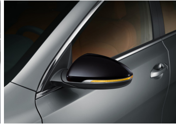
블랙하이그로시 아웃사이드 미러 커버