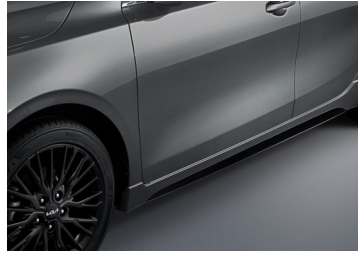
블랙하이그로시 사이드실 몰딩