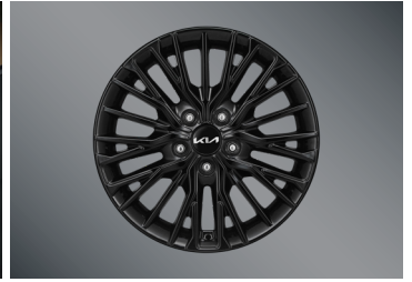
17인치 블랙 휠