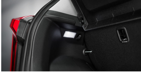
LED 러기지 램프