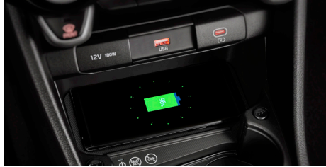
스마트폰 무선충전 시스템