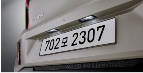
LED 번호판 램프