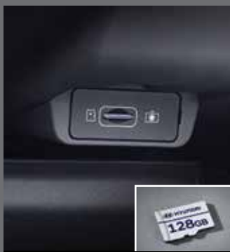
블투스 캠프 2 전용 마이크로SD 카드(128GB)