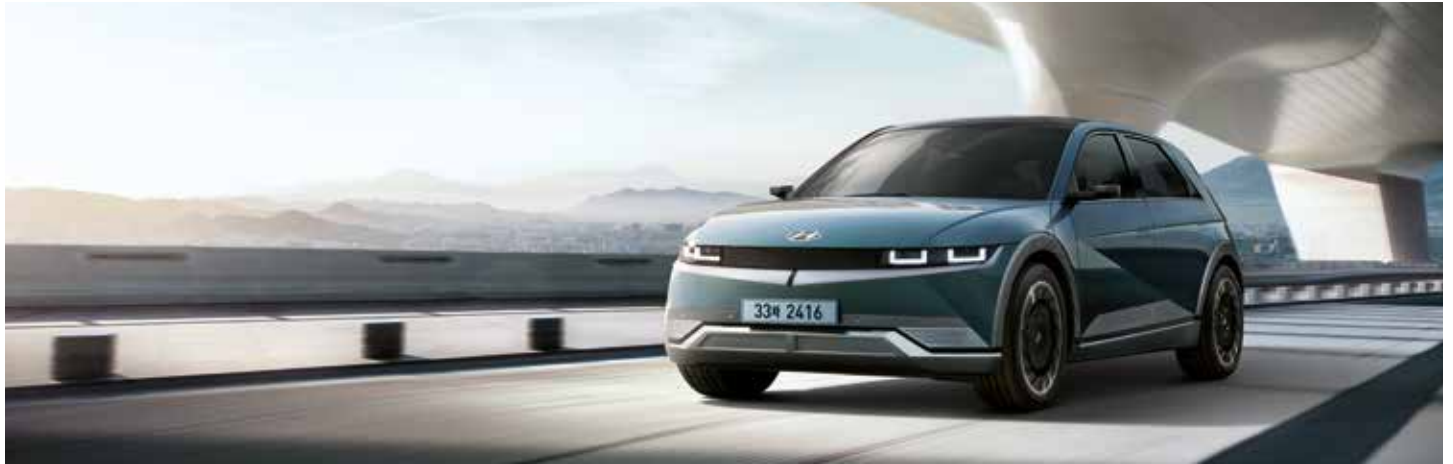
프레스티지 풀옵션(디지털 팀그린 펠)

최초의 경험으로 가득찬 새로운 모빌리티 시대가 열립니다. 무엇이든 가능한 세상, IONIQ 5를 경험하세요.