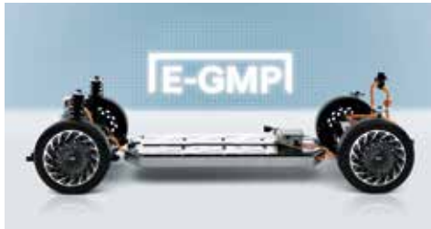
E-GMP 차세대 전기차 플랫폼