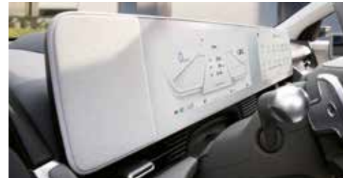
클러스터(12.3인치 컬러 LCD) / 12.3인치 내비게이션